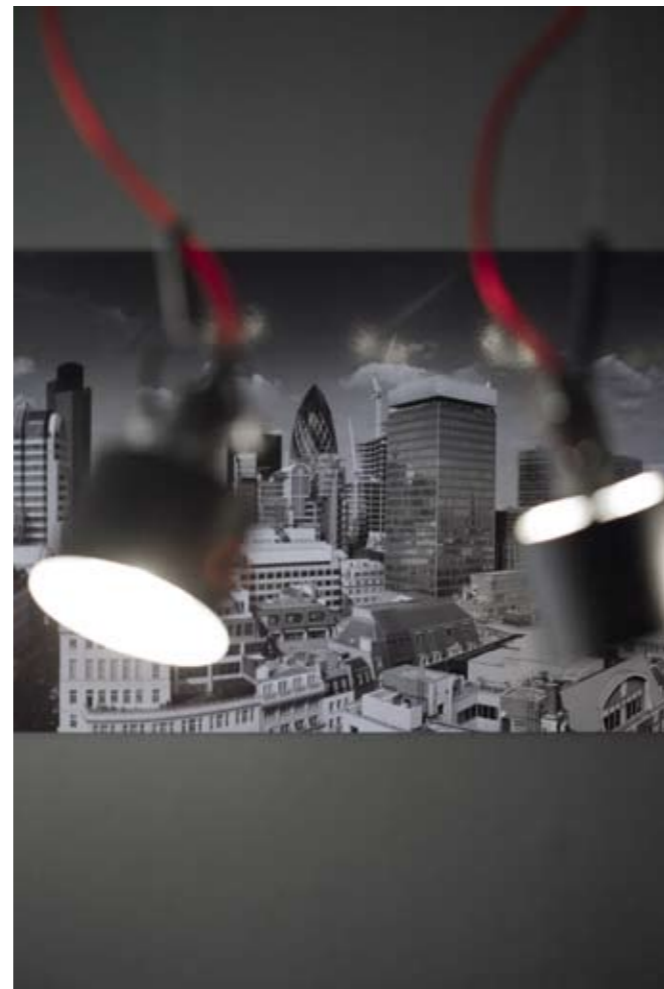
ГОРЕ И НА СТРАНИЦАТА ВДЯСНО: ДИРЕКТОРСКИЯТ КАБИНЕТ. ИНТЕРИОРЪТ СЪЧЕТАВА МОДЕРЕН И КЛАСИЧЕСКИ ДИЗАЙН. КОРПУСНИТЕ МЕБЕЛИ СА ПРОЕКТИРАНИ ОТ ABCD STUDIO. ДИВАН ОТ СЪСТАРЕНА КОЖА, ЛАМПИ И АКСЕСОАРИ ОТ ШОУРУМ KARE, СТОЛОВЕ ОТ ШОУРУМ ХЕЛИКС