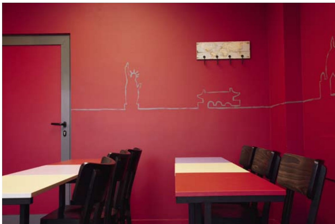
УЧЕБНИТЕ СТАИ СА БОЯДИСАНИ В СИНЬО ИЛИ ЧЕРВЕНО, С ГРАФИЧНИ РИСУНКИ НА СТЕНИТЕ. МАСИТЕ, ИЗРАБОТЕНИ ПО ПРОЕКТ ОТ МЕТАЛ И ЦВЕТЕН MDF, СА ИНДИВИДУАЛНИ, НО ЛЕСНО МОГАТ ДА СЕ КОМБИНИРАТ