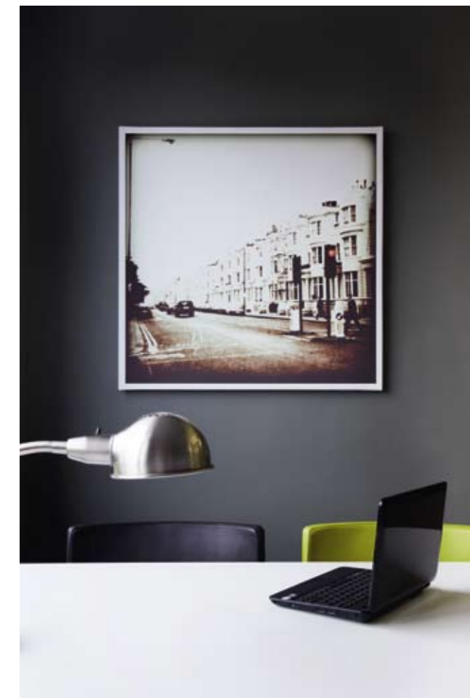
НА ТАЗИ СТРАНИЦА И ВЛЯВО: ЗАСЕДАТЕЛНАТА ЗАЛА Е МНОГОФУНКЦИОНАЛНО ОТВОРЕНО ПРОСТРАНСТВО. СЪТЪКЛЕНИТЕ СТЕНИ Я ОБЕДИНЯВАТ ВИЗУАЛНО С КОРИДОРА. МЕБЕЛИТЕ СА ИЗРАБОТЕНИ ПО ПРОЕКТ, СТОЛОВОТЕ СА ОТ ИКЕА